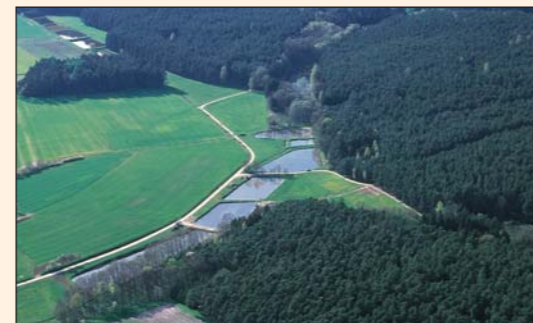
Weg zum Schlossberg

Diese Wanderstrecken durch eine reizvolle, abwechslungsreiche Landschaft bieten Ihnen Möglichkeiten zum Rasten und zur Einkehr; lassen Sie sich mit gepflegten Getränken und Speisen aus heimischen Erzeugnissen bewirten (vgl. Seite 2).