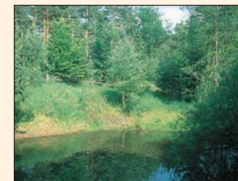
Tränke beim „Bettelhütlein“

Vom Parkplatz Hugenottenhalle durch das Gewerbegebiet und auf einem Schotterweg parallel neben der Kreisstraße bis zu zwei Birken in Höhe des Waldsportplatzes ➔ rechts abbiegen und auf einem befestigten Weg durch Felder nach Oberalbach. Durch die Ortschaft, am Ortseende zunächst ➔ rechts und nach 50 m ➔ links abbiegen, entlang Weihern, Feldern und Wiesen und dann auf dem Waldweg nach Hohholz. Zur Rechten erhebt sich der bewaldete Schlossberg, auf dessen Höhe einst eine Raubritterburg thronte (zu erwandern auf dem Alternativ-Weg W 6).